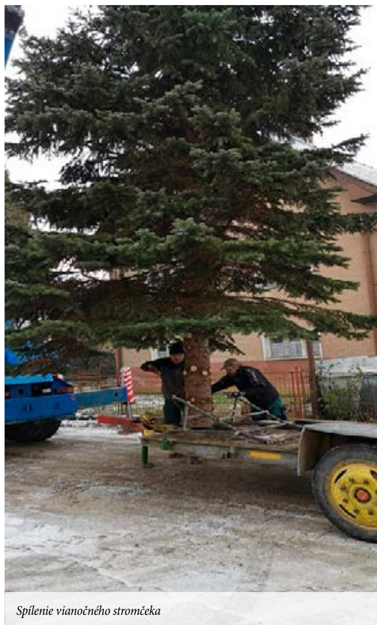
Spílenie vianočného stromčeka