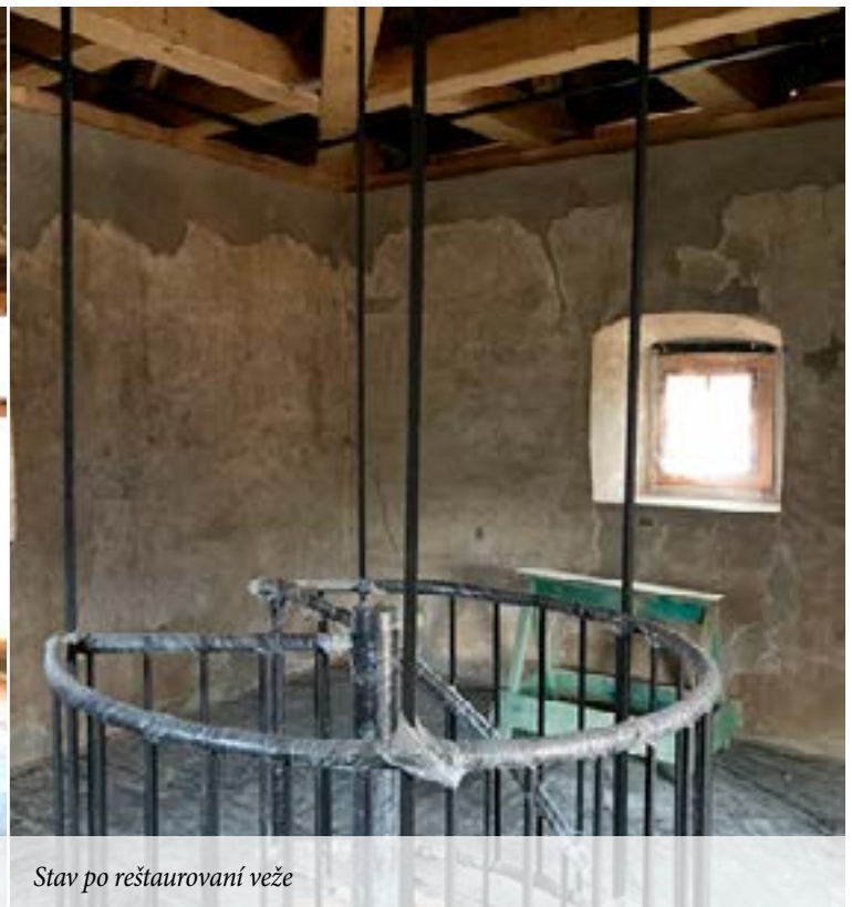
Stav po reštaurovaní veže