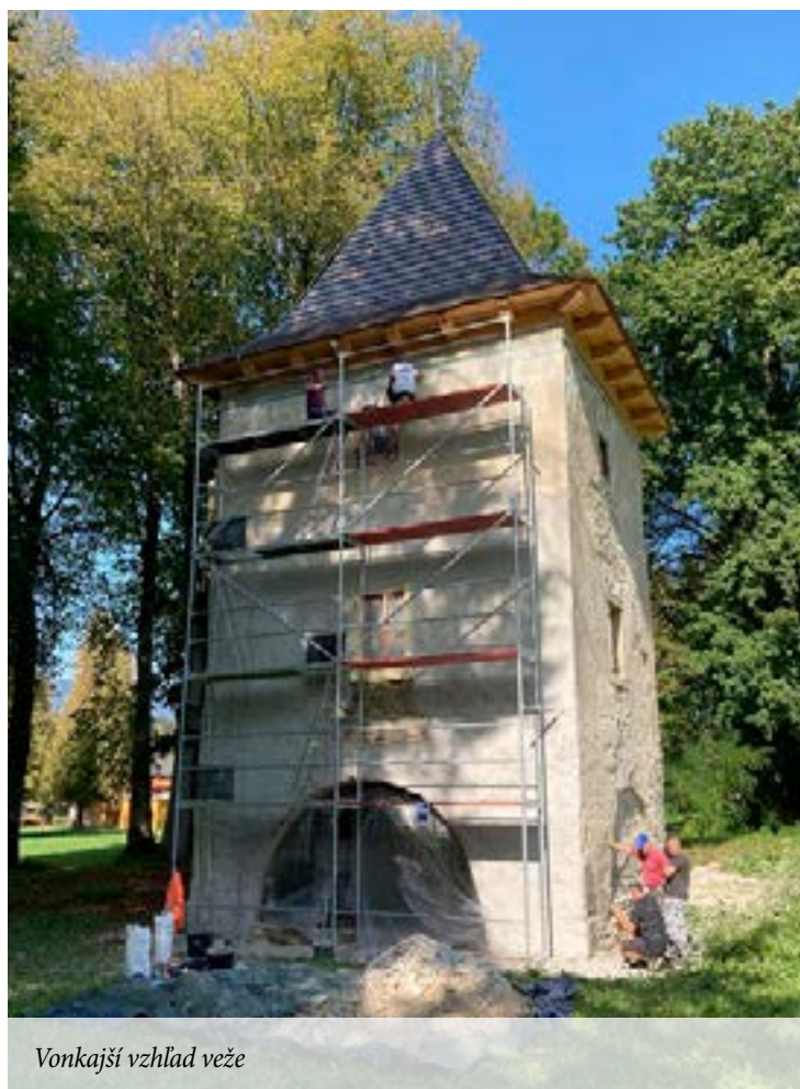
Vonkajší vzhľad veže