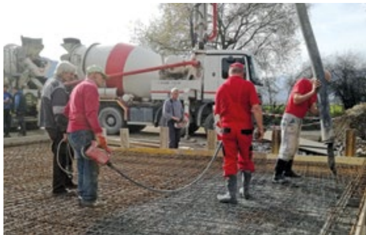
Obec opravila most na miestnej komunikácii v Zábreží smerom do Žaškova.

Kedy sa bude s asfaltovaním pokračovať? Netuším. To je otázka na niekoho iného, na toho, v ktorého kompetenciách je zabezpečovanie a spravovanie peňazí potrebných na chod obce. Možno to bude o rok, možno o päť, možno o desať. Uvidíme.