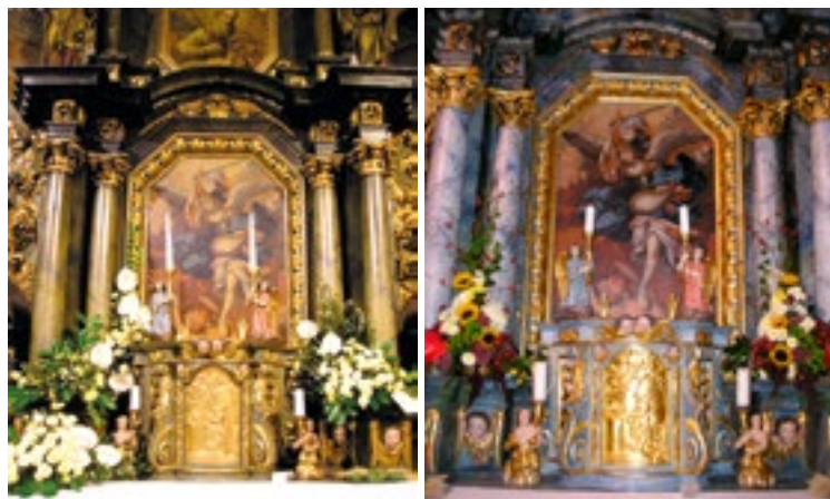
Oltár sv. Michala Archanjela pred rekonštrukciou a po rekonštrukcii