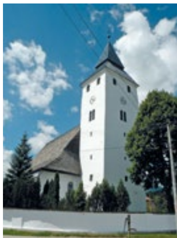
Priestor okolo kostola dodnes obklopuje oplotenie, kedysi obranný múr. Veža vysoká 42 metrov dostala nový náter vďaka horolezcom.