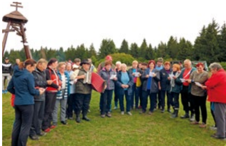
Stretnutie štyroch chotárov

Obecný úrad a miestna organizácia ZPOZu zorganizovali 15. novembra uvítanie nových občanov a posedenie s manželskými párami, ktoré mali v tomto roku výročie svadby. V Oravskej Porube pribudlo 16 detí - 9 dievčat a 7 chlapcov. Pripomenuli sme si dva zlaté (50 rokov) a tri strieborné (25) sobáše.